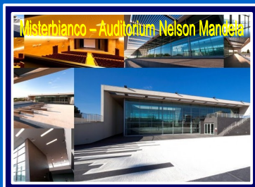
Misterbianco - Auditorium Nelson Mandela

Iscrizioni e prenotazioni: info@baroneventi.it ; Tel. 095.3521671