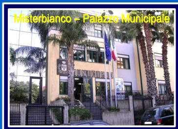
Misterbianco - Palazzo Municipale